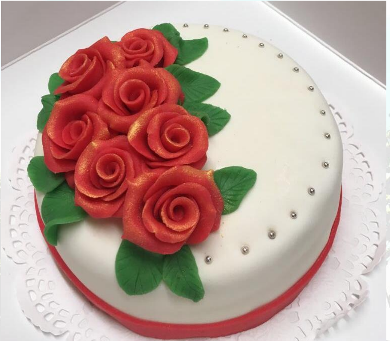
Bruidstaart – Traditioneel