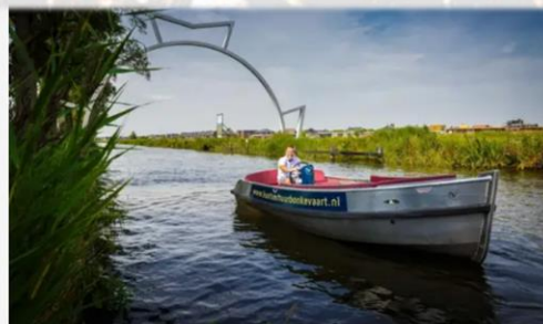
Ruime Luxe E-sloep 590