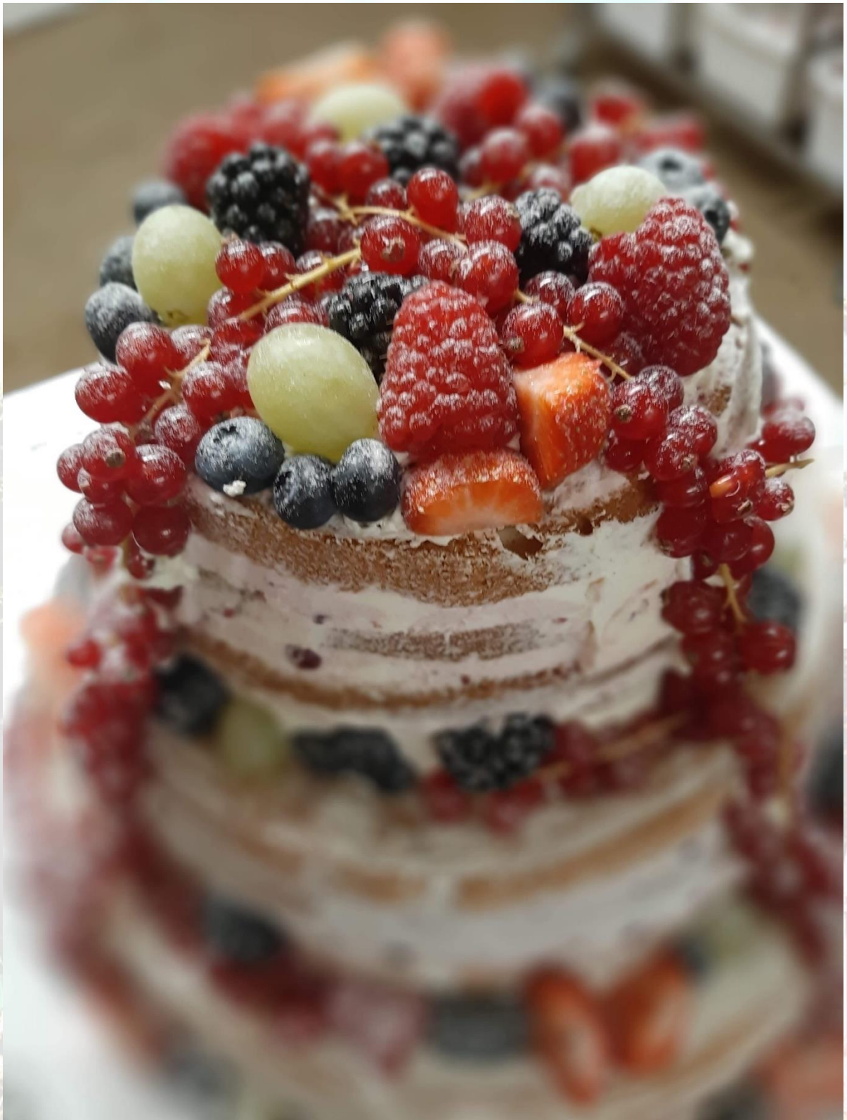
Naked cake – heel populair