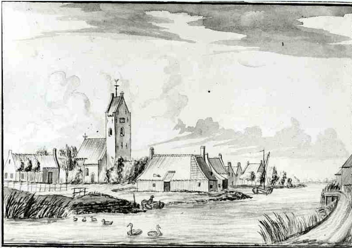
het dorp Wyns aan de Fij Soals 't was int 't Jaar 1747