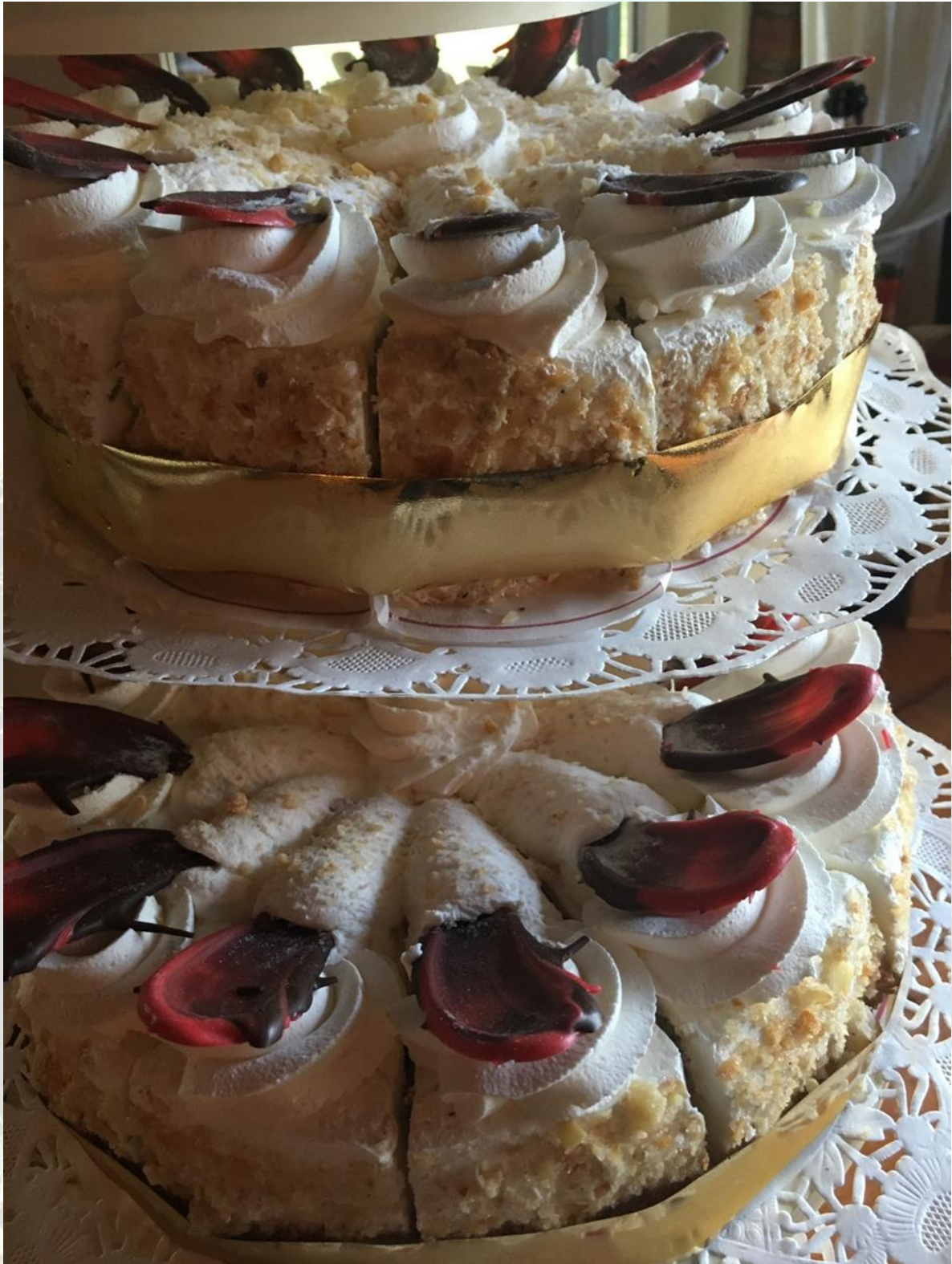
Hazelnootschuim – reeds in punten gesneden