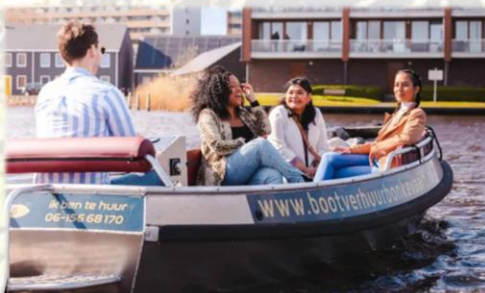
Comfortabele Greensilver 500e